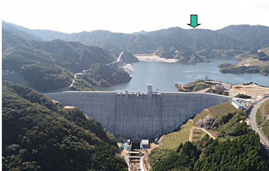
写真③ 福岡県営五ヶ山ダムと 245T 剤埋設地の位置関係