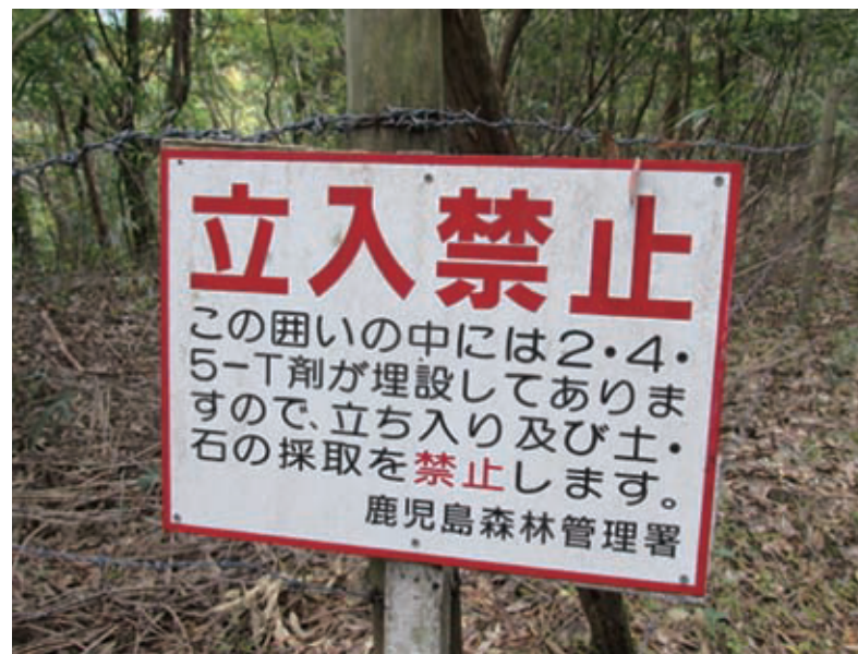
写真④ 鹿兒島県湧水町の 245T 剤の埋設地