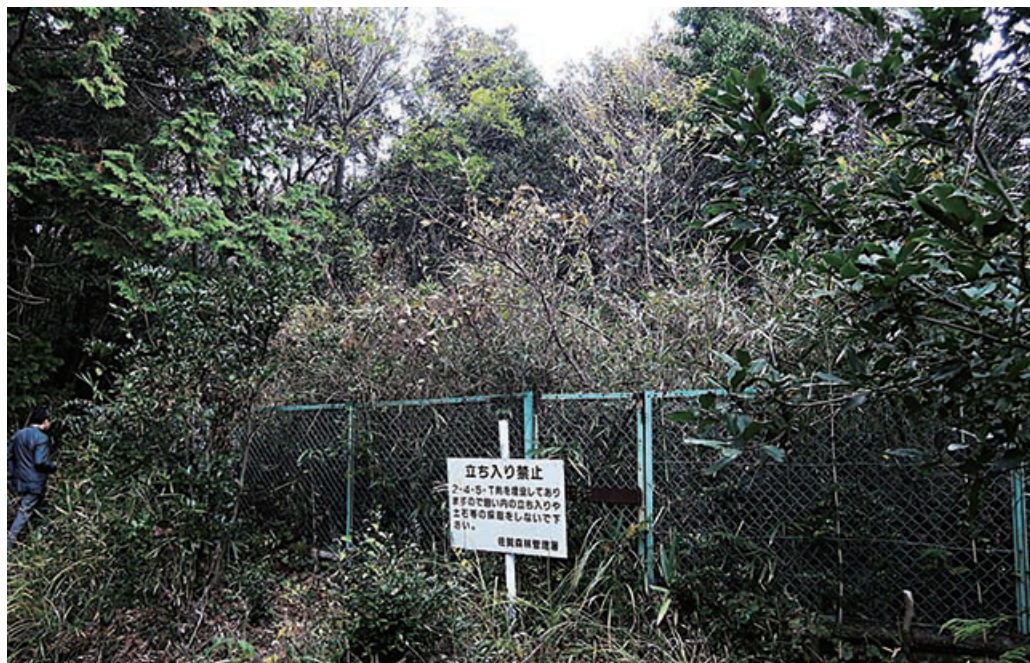
写真① 佐賀県吉野ヶ里町の 245T 剤埋設地の様子