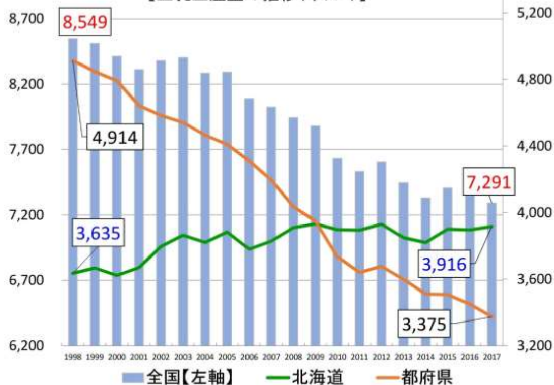
【生乳生産量の推移(千トン)】