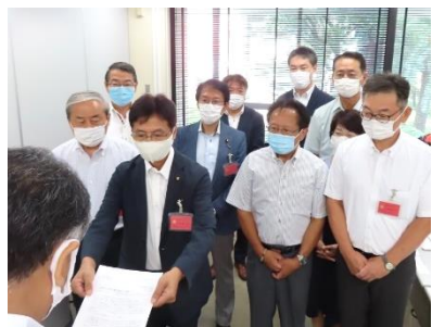
大分県議団、日田市議団と国交省九州地方整備局に河川の復旧・整備を要望 (8/24)