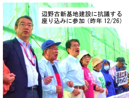
辺野古新基地建設に抗議する座り込みに参加（昨年12/26）