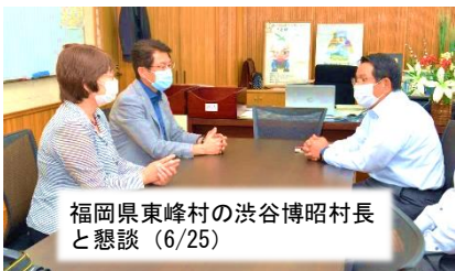
福岡県東峰村の渋谷博昭村長と懇談（6/25）

沿線自治体・住民とともにJR九州のバス・BRT復旧案に反対。国会で何度もとりあげました。九州の鉄道ネットワークの維持にこれからも力を尽くします。