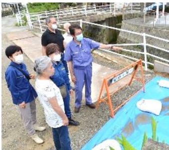
被災者から被害状況を聞く (7/20、福岡県大牟田市)