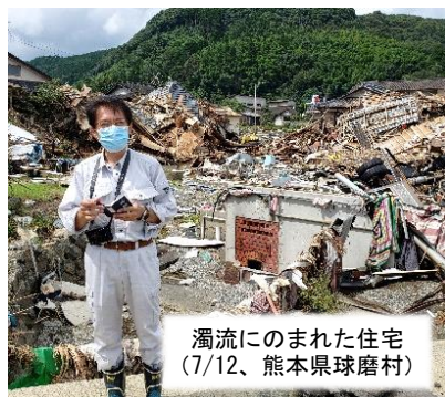
濁流にのまれた住宅 (7/12、熊本県球磨村)

国会で再三求めてきた被災者の願いが実現！被災者生活再建支援制度に半壊が対象となり支援金が支出されます。住宅と生業の再建に全力。