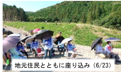
地元住民とともに座り込み（6/23）

ダム建設予定地に住む13世帯を行政代執行で排除することに抗議。水の需要もなく、治水にも役立たないダムに、国費の投入は認められません。