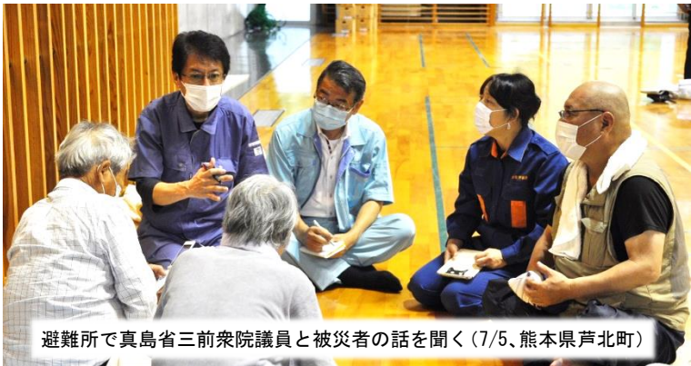
避難所で真島省三前衆院議員と被災者の話を聞く (7/5、熊本県芦北町)