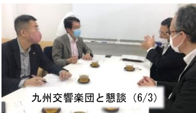
九州交響楽団と懇談 (6/3)

医療、労働、文化、観光など様々な団体と懇談を重ね、影響・損失支援を政府に対策を迫っています。共産党の主張、野党共同の力で、PCR検査の拡大、10 万円の定額給付、持続化補助金制度の改善、学生支援、家賃補助などが実現。引き続きがんばります。