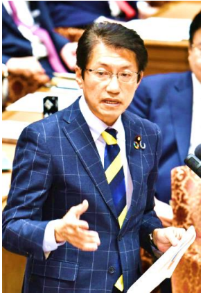
菅義偉官房長官、河野太郎防衛相らに、米軍訓練施設建設計画の撤回を求める (2/18 衆院予算委員会)

政府が馬毛島（鹿児島県西之表市）への米空母艦載機離着陸訓練（FCLP）移転を地元の頭越しに進めている問題をめぐり、国会審議を経ない予算の「流用」で土地買収を行うなど、米軍のためなら何でもありの政府の姿勢を厳しく追及しました。