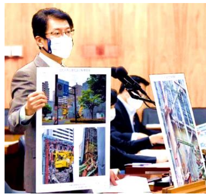
福岡県建設労働組合（福建労）提供の建設現場の写真を示し、小泉進次郎環境相にアスベスト対策の抜本強化を提案（5/15 衆院環境委員会）