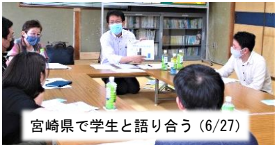
宮崎県で学生と語り合う (6/27)