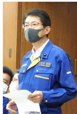
災害対策特別委員会 (7/28)

新型コロナウイルスの感染拡大のなかでの豪雨災害。中小業者の「もう借金はできない」の声を委員会質問でぶつけ、直接支援を強く要求。政府は熊本で上限 5 億円、福岡・大分・佐賀・鹿児島で上限 1 億円の定額補助金を新設しました。「コロナと水害の二重の被害」のみの条件で適用を広げさせます。