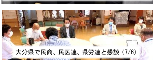
大分県で民商、民医連、県労連と懇談 (7/6)