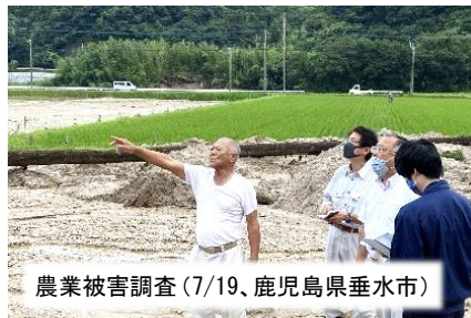
農業被害調査 (7/19、鹿児島県垂水市)