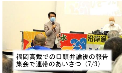
福岡高裁での口頭弁論後の報告集会で連帯のあいさつ（7/3）

諫早湾干拓事業により農漁業に深刻な影響が出ています。昨年末には有明沿岸4県の地方議員らと現地を視察。開門調査を超党派で求めています。