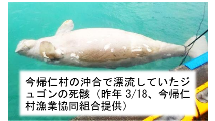
今帰仁村の沖合で漂流していたジュゴンの死骸（昨年3/18、今帰仁村漁業協同組合提供）

沖縄本島北部に生息するジュゴンが絶滅の危機に瀕しています。3頭のうち1頭が死亡。国会質問で、辺野古の工事を止めて緊急に生息調査をするよう求めました。