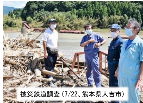
被災鉄道調査 (7/22、熊本県人吉市)

JR 肥薩線・久大線、第 3 セクターの肥薩おれんじ鉄道とくまがわ鉄道が被災。鉄道での復旧を支援するよう求めました。