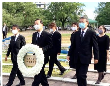
終戦 75 年の街頭演説 (8/15)

長崎市の爆心地公園で、志位和夫委員長、仁比聡平前参院議員、真島省三前衆院議員と献花 (8/8)