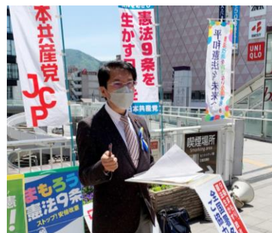
ロシアのウクライナ侵略に抗議し、憲法9条をいかした「外交ビジョン」を訴える（5月3日、小倉駅前）