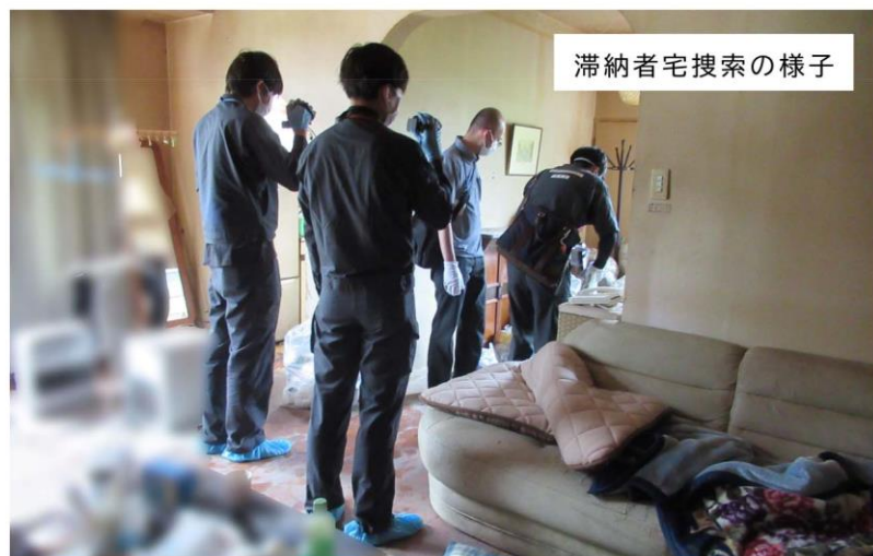
滞納者宅搜索の様子