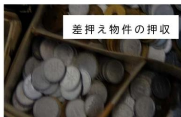
差し押え物件の押収