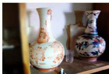
差し押え物件の押収